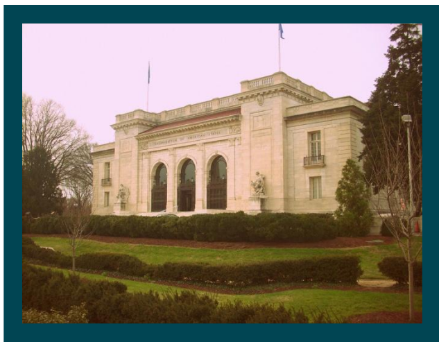
El edificio de la Organización de Estados Americanos

En el problema mundial de las drogas, para entender la lógica de su dinámica, hay que situar la clave en el terreno del funcionamiento de los mercados. Todo el circuito de producción,