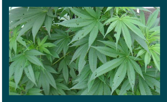
Planta de marijuana

El nudo central de las políticas en el discurso es comenzar a hablar de mecanismos de regulación de sustancias . Hay que incorporar este concepto a los discursos y a los diseños de esquemas de fiscalización. Desde esa óptica, hay propuestas concretas para desplegar. Pero en términos de cuáles son las claves del debate que se debe impulsar desde la gestión pública en drogas, me parece mejor instalar la cuestión en estos términos que en la escisión penalización-liberalización. Esta escisión y polarización se desarrollan normalmente, sin drama, en el seno de la sociedad civil. Pero desde las políticas públicas, lo interesante y productivo es ver el amplio y variado abanico de posibilidades, las cuales permiten visualizar el conjunto de herramientas que van desde aspectos prohibitivos (aplicable a niños, mujeres embarazadas, personas que conducen o realizan tareas peligrosas, sólo para poner algunos ejemplos), hasta controles fiscales, administrativos, médicos, laborales y de conjugación entre lo público y lo privado. El rol del Estado en materia de producción y comercialización es clave. Claro que esto nos conecta nuevamente con el mundo de las Convenciones. El tema es que siempre van a