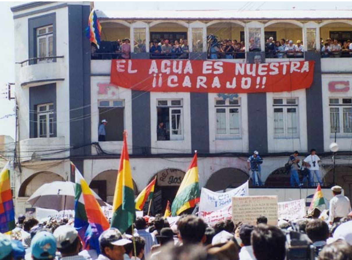
Guerra del agua. Cochabamba abril del año 2000.