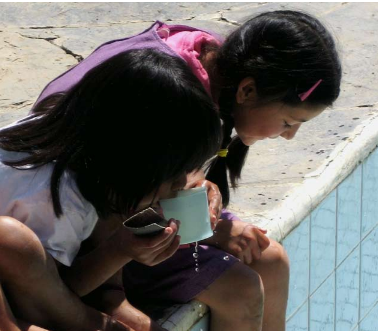
Las cuidadoras del agua, esperanza para un futuro digno. Cochabamba, 2009.