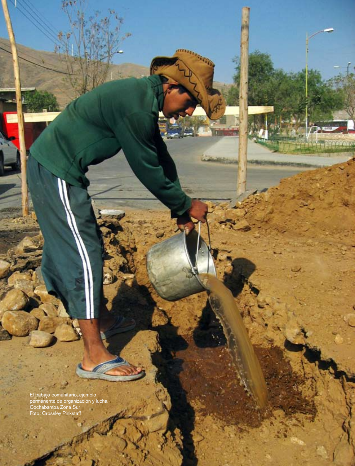
El trabajo comunitario, ejemplo permanente de organización y lucha. Cochabamba Zona Sur