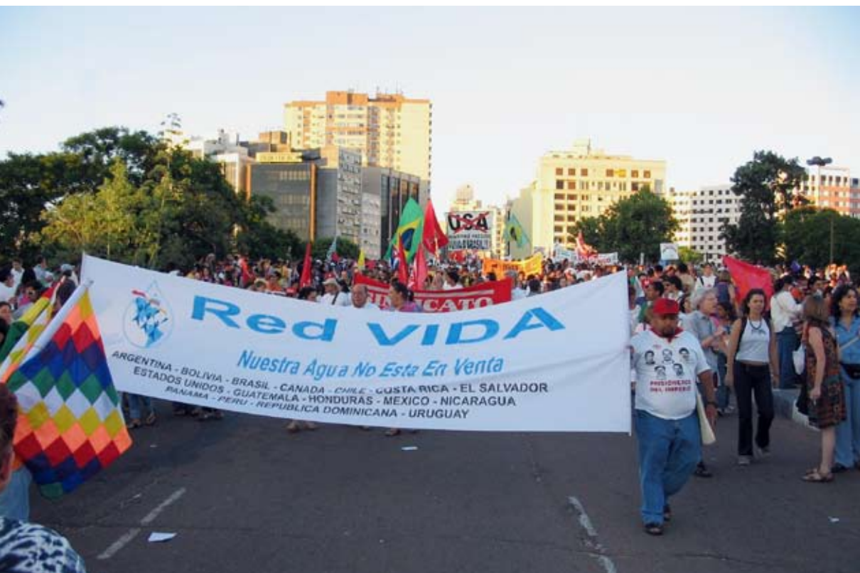
Foro Social Mundial. Porto Alegre. Brasil, 2005.