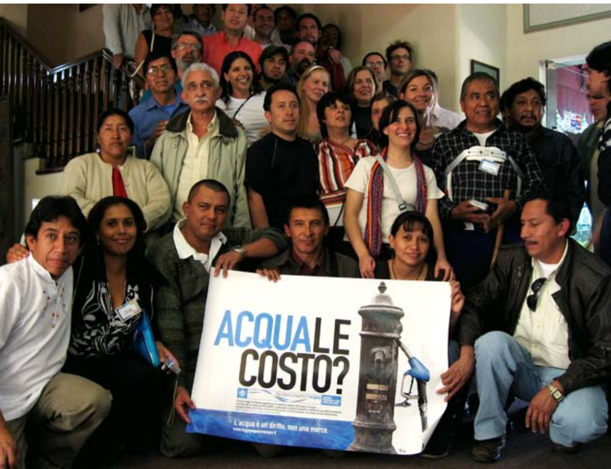
Agua un bien común. Gestión Pública y Alternativas. Cochabamba, agosto 2008.