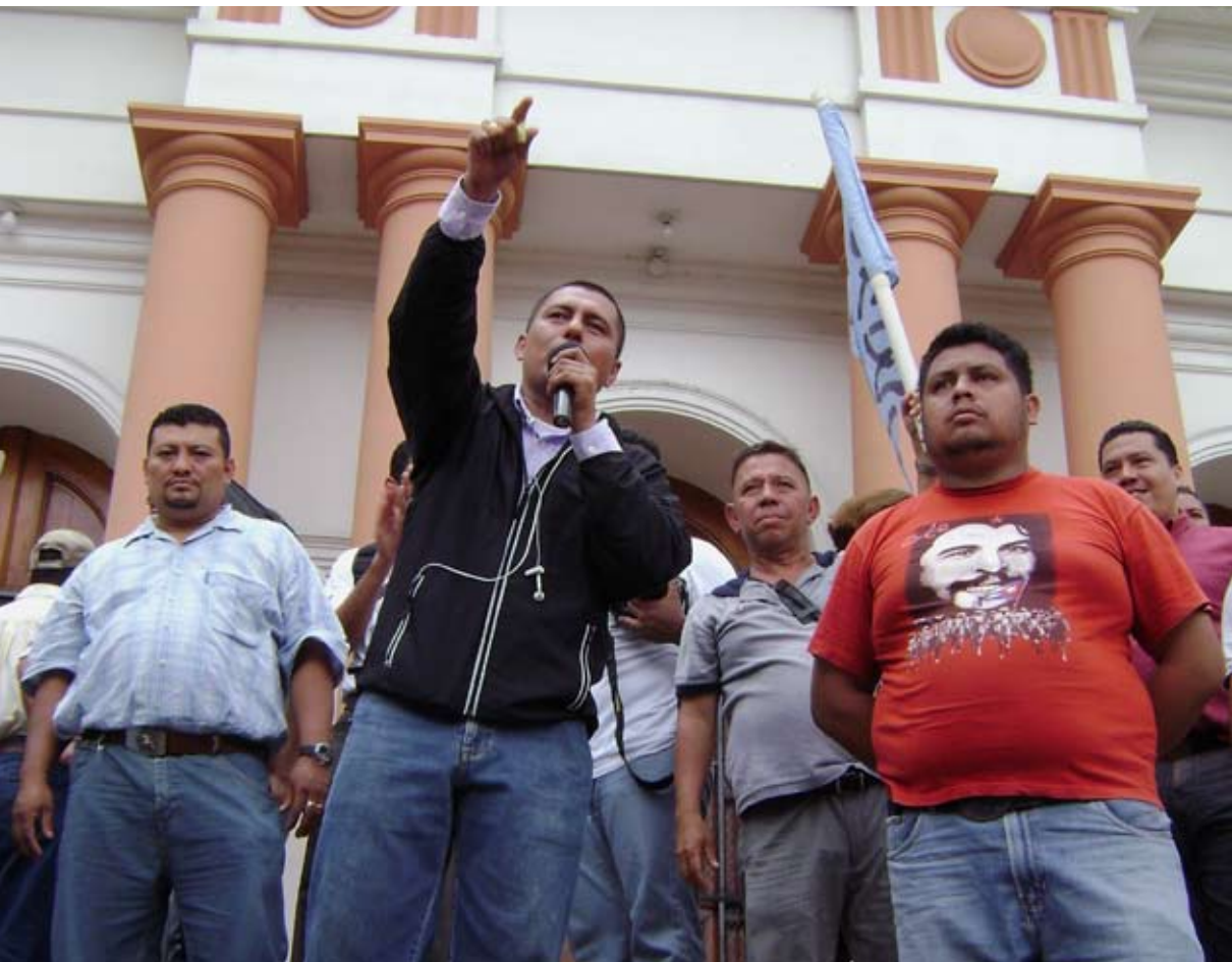
Mobilización del Bloque Popular en Honduras.