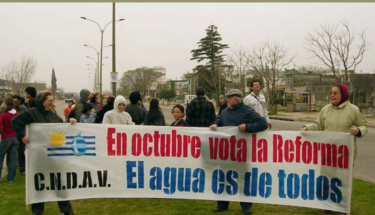
Campaña por la Reforma Constitucional. Octubre 2004, Uruguay.