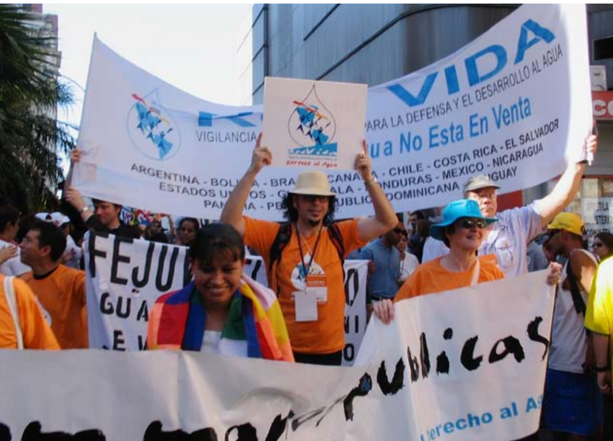
Foro Social Mundial. Marcha de apertura. Porto Alegre Brasil, 2005.