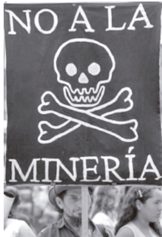
Fuente: La Mesa Nacional frente a la Minería Metálica en El Salvador