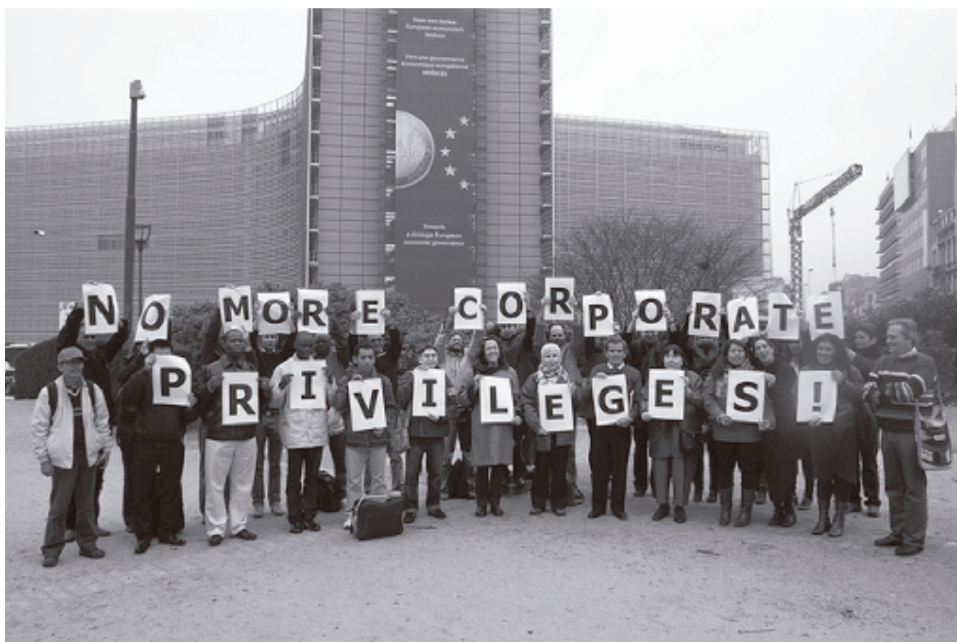
No más privilegios corporativos

El sistema internacional de reglas de inversión y los tribunales son una amenaza para los esfuerzos de las comunidades en todo el mundo que buscan proteger sus recursos básicos y defender sus derechos. Solo podemos desafiar este sistema mediante la unión. Podemos trabajar juntos ayudando directamente en la lucha en contra de estos casos, como con el triunfo global de la ciudadanía sobre Bechtel. Podemos presionar a los gobiernos para que se retiren del sistema de tribunales, como lo han empezado a hacer Bolivia, Ecuador y Venezuela. También podemos presionar a los gobiernos para que rechacen ingresar en cualquier nuevo acuerdo de inversión que otorga a las corporaciones el derecho a demandar a los países en tribunales internacionales, una posición emprendida por Australia, India y Corea del Sur.