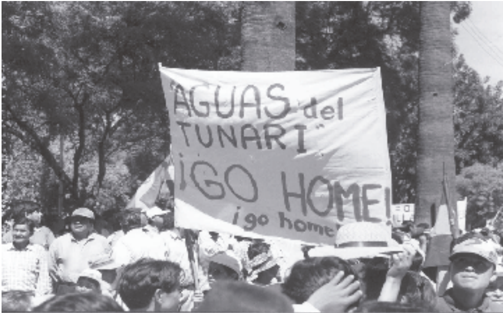
Guerra del Agua, 2000