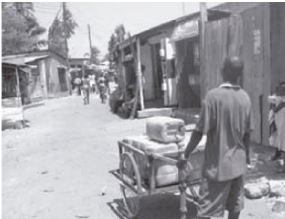
Vendedores informales de agua empujan carretas con bidones llenos de agua.