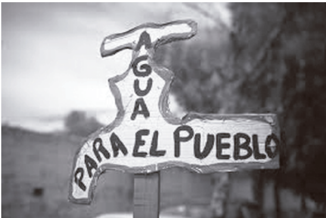
'Agua para el pueblo'