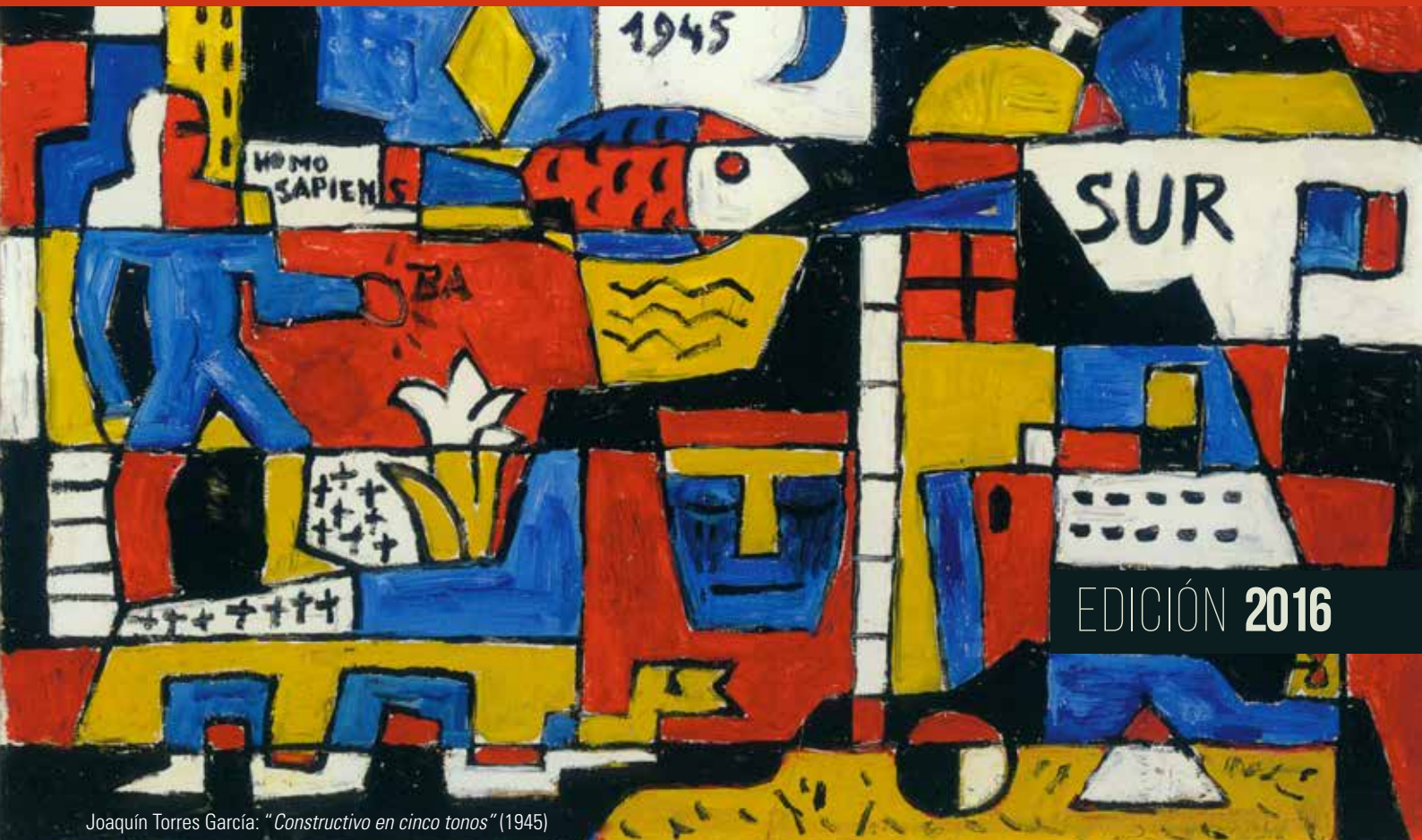
Joaquín Torres García: "Constructivo en cinco tonos" (1945)